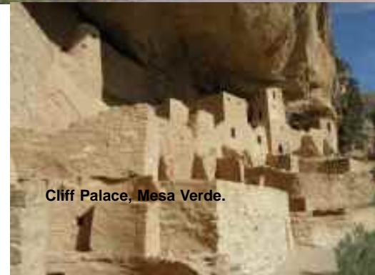
Cliff Palace, Mesa Verde.

Die siebte Reise führt in den Südwesten Nordamerikas an Plätze, die einst von erregenden historischen Ereignissen geprägt wurden und die Entwicklung der amerikanischen Besiedlung maßgeblich beeinflussten. Erleben Sie die sonnendurchglühten Ebenen, die spektakulären Wüsten und gigantischen Felsformationen einer überwältigenden Landschaft.