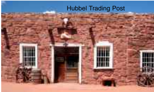
Hubbel Trading Post

20. 5. Freitag: Die große Tour beginnt und führt von Denver aus nordwärts. Bei Cheyenne biegen wir nach Westen ab und fahren durch die zerklüftete Landschaft des südlichen Wyomings auf den Spuren des Lincoln Highway – der ersten transkontinentalen Autoverbindung durch Nordamerika – nach Rawlins. In dieser einstigen Eisenbahnerstadt steht das zweite Staatszuchthaus von Wyoming, heute ein eindrucksvolles, Gänsehaut erzeugendes