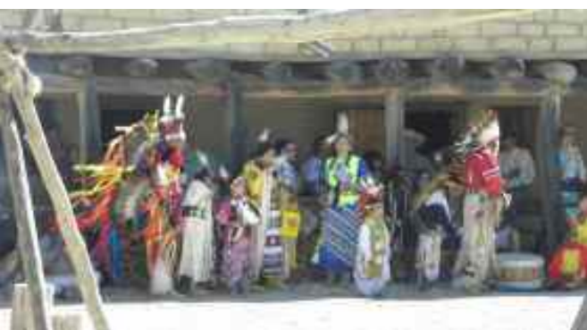
Arapaho-Indianer in Fort Bent.

25. 5. Mittwoch: Wir fahren ins Land der Navajo-Indianer und besuchen den Canyon de Chelly, eines der großen Naturwunder des amerikanischen Südwestens mit dem Spider Rock - in der Mythologie der Navajo der Sitz der Spinnengöttin. Übernachtung in Chinle.