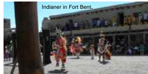
Indianer in Fort Bent.

5. 6. Sonntag: Rückfahrt nach Denver. Eine Reise voller überwältigender Eindrücke und Erlebnisse neigt sich dem Ende zu.