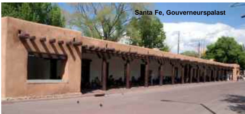
Santa Fe, Gouverneurspalast