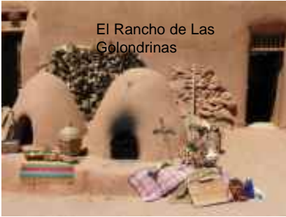
El Rancho de Las Golondrinas

stens. Weiter geht es dann nach Santa Fe, die Hauptstadt von New Mexico, mit dem Palace of the Governors, dem ältesten Regierungsgebäude der USA.