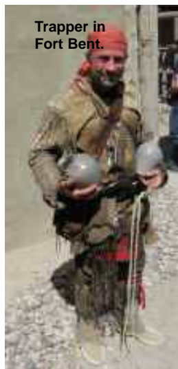
Trapper in Fort Bent.

Erfahren Sie dramatische Geschichte. Reisen Sie auf der Route, der einst die Union Pacific-Schienen folgten, über die Hunderttausende von mutigen Pionieren mit ihren Ochsenkarren in die Wildnis eindrangen, auf denen vor Ihnen berühmte Trapper und große Indianerhäuptlinge gegangen sind.