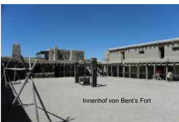
Innenhof von Bent's Fort